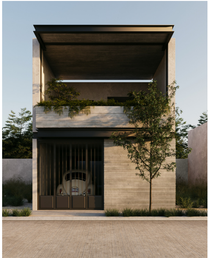
CASA FRENTE AL PARQUE Formas simples. Vigas de acero y concreto aparente. Alternativas de recubrimientos y acabados en fachada.